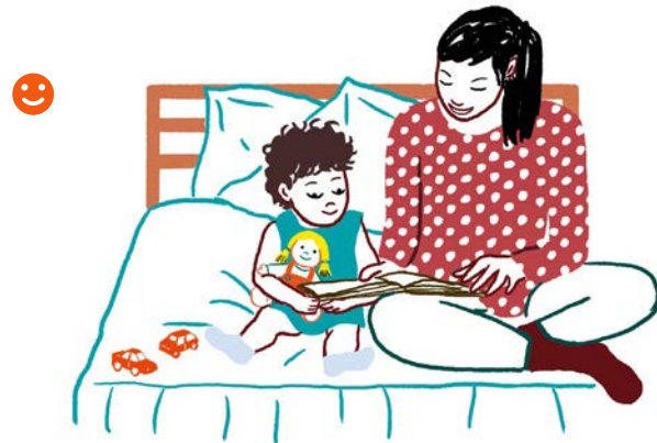
Avant de dormir