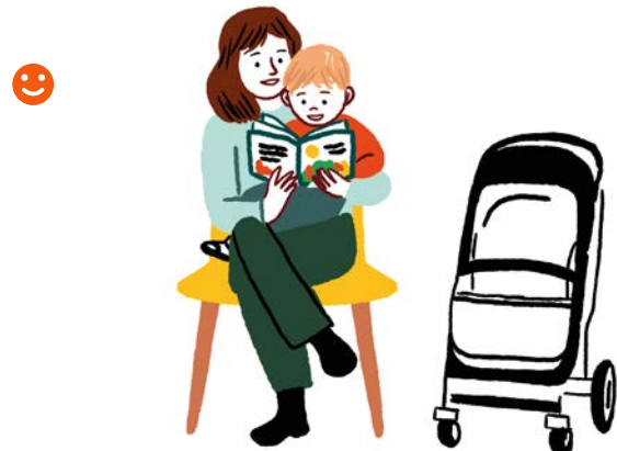
Avant un rendez-vous